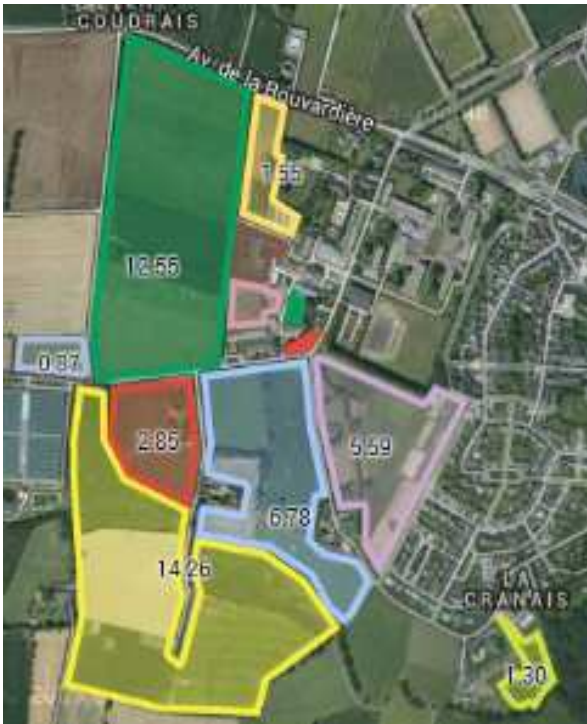
Parcelles autour du lycée Environ 50ha

SAU totale : 69 ha (SFP : 63 ha en 2014) Surface dédiée à l'Expé: 3 ha L'ensemble des cultures conduites en AB Taille moyenne des parcelles : < 8 ha 5 km de distance entre les 2 lots de parcelles