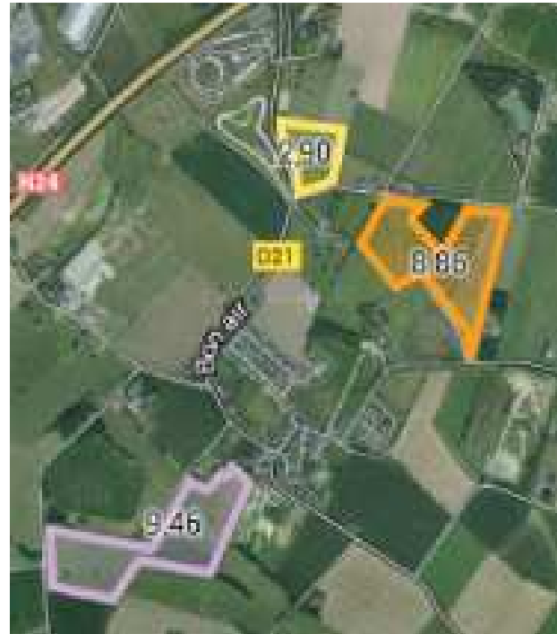
Parcelles de Moigné Environ 20ha Sols hydromorphes

Sols limono-sableux profonds avec bon potentiel